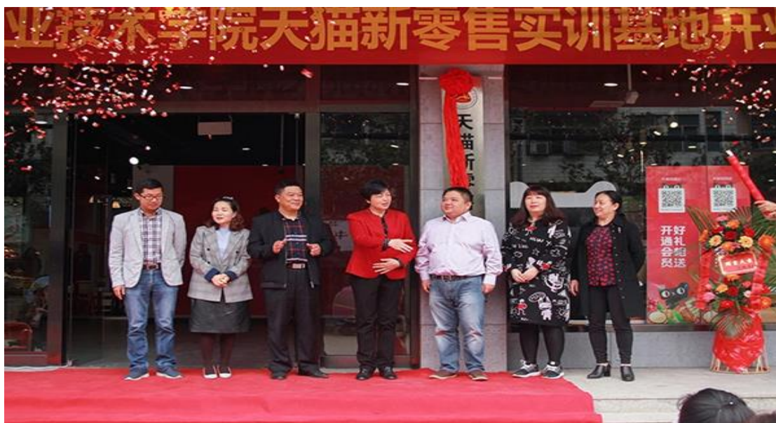
湖南商务职业技术学院天猫零售实训基地开业

学院与天猫校园华南运营中心、湖南新雷特电子商务有限公司产教无缝融合的校园开猫新零售实训基地于 2018 年 10 月 19 日上午隆重举行揭牌仪式。天猫新零售实训基地是企业更好推进新零售发展、培养人才梯队，学院更好适应时代、服务学生的双赢之举，是学院进行现代学徒制试点的重要内容，主要通过开设天猫新零售学徒制班和向全院开放短期实训班两种方式进行学徒制人才培养。