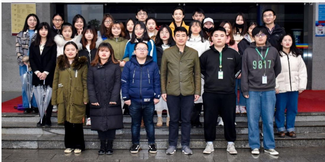
湖南商务职业技术学院 2019 年巴拉巴拉学徒班合影